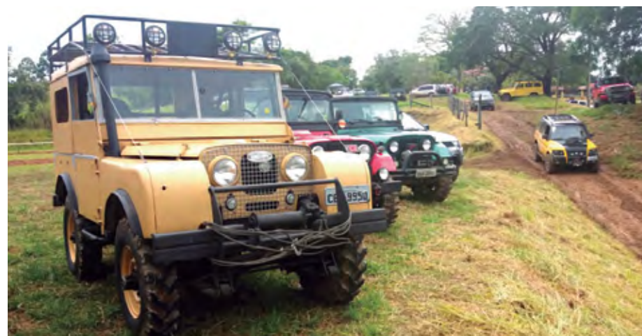
Quase 200 máquinas marcaram presença

Além das pistas de arancadão e raid, com vários níveis de dificuldade, o público ainda pôde se divertir com as bandas de