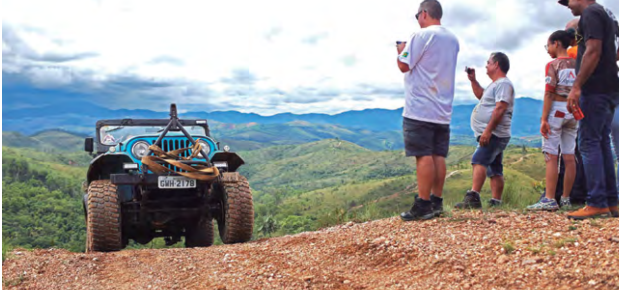
Montanhas mineiras deram o tom da aventura

A cidade de Caeté, município a 50 km de Belo Horizonte/MG, realiza há quase dez anos o Trilhão de aniversário. Em 2019, o já tradicional evento comemorou os 305 anos da cidade e aconteceu no domingo, 17 de fevereiro, com a participação de cinco modalidades esportivas: corrida rústica, bikes, motos, gaiolas e jipes. Foram 628 pessoas inscritas, que se concentraram no Ginásio Poliesportivo, desde às 7h, onde fizeram um café da manhã reforçado e se prepararam para a largada de suas respectivas categorias.