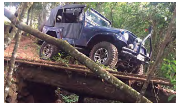
Caminhos sinuosos chamaram a atenção

A ideia da Equipe Tropa 4x4 era proporcionar emo-