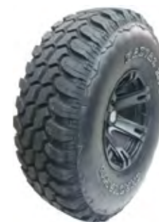
Pneu 35x12,5 R17 Westlake Tires MT/Mud Terrain À vista no boleto: R$ 1.022,07 ou 6x de R$ 183,17