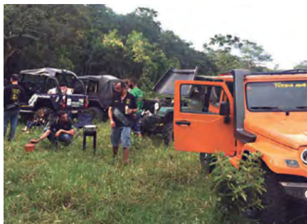
Não faltou aquele clima de amizade

O passeio trouxe travessia de obstáculos com pedra, barro e erosões, além da passagem por uma ponte caída, descida de monte de aproximadamente 50 graus com ancoragem por guincho traseiro e obstáculos diversos.