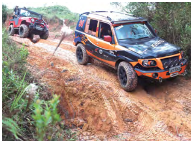
Participantes mostraram técnica

da pelas bicicletas, motos, gaiolas e jipes (trilha leve e pesada). Cada uma das modalidades teve um percurso