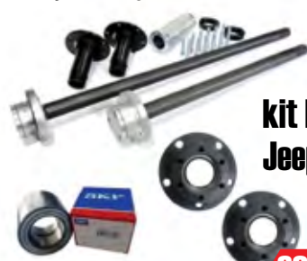
Kit Ponta de Eixo Jeep / Rural