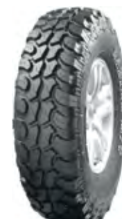
Pneu 285/70 R17 WestLake - Mud Terrain 70% OFF-Road 30% On-Road À vista no boleto: R$ 1.057,41 ou 6x de R$ 189,50