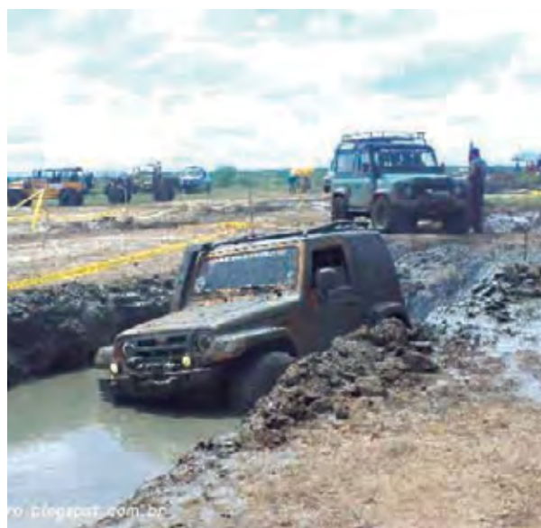
Emoção e adrenalina em cada parte da pista

A programação teve início na noite de sexta-feira, quando os jipeiros foram recepcionados no Lagamar com churrasco e música ao vivo enquanto faziam suas inscrições e confraternizavam. Na manhã do sábado, também no Lagamar, após o café da manhã servido aos ins-