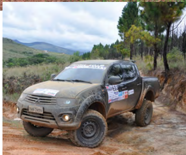
Prova foi elogiada pelos pilotos

No sábado, devido as chuvas a largada aconteceu às 12h para um trajeto repleto de surpresas. Competidores vindos de diversas cidades de Minas Gerais e também do Rio de Janeiro, Espírito Santo, Santa Catarina e São Paulo enfrentaram 92 km pelas estradas e trilhas da região. O reflorestamento Saint Cobain com seus balaios “acordou” a moçada pois qualquer erro seria fatal em busca do lugar mais alto do pódio. De lá seguiram para