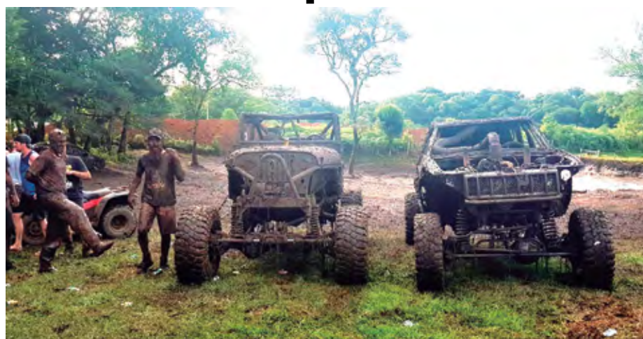
Galera se pintou de barro

gaiolas, jeep, pick-ups, tratores e carros brincaram em uma área de barro