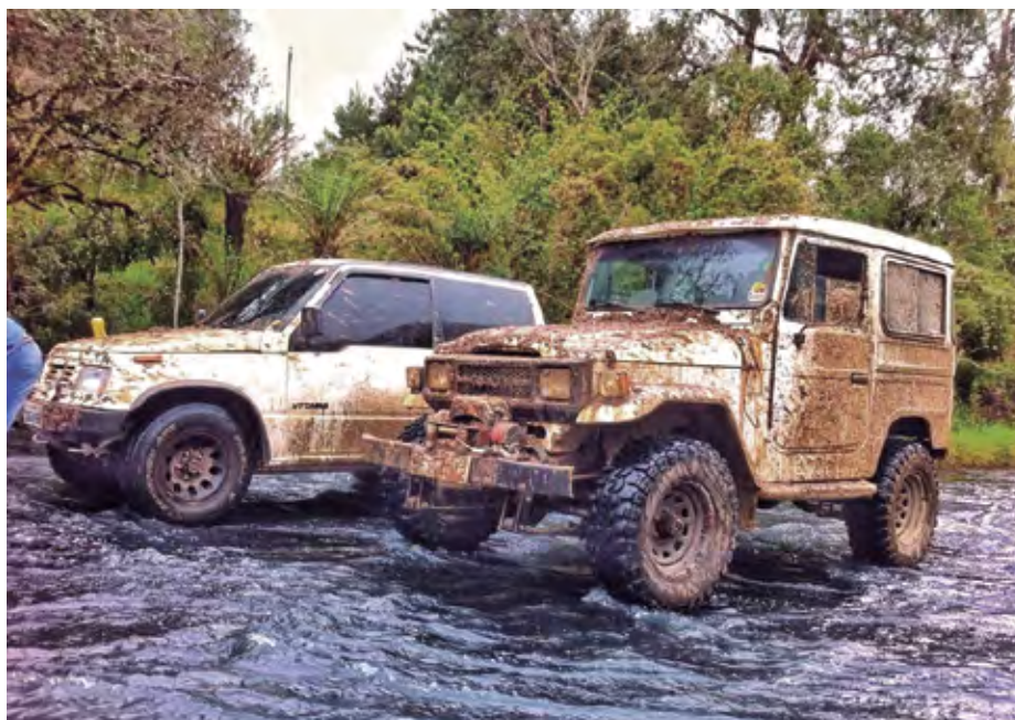
Aventura promete o melhor do fora de estrada

Além da trilha pesada, o evento também disponibiliza um belíssimo passeio 4x4, para qualquer tipo de veículo fora de estrada, com um percurso de 40 km, e largada programada também para 13h30. O passeio passa por estradas de reflorestamento, travessias de rios, estradão, e também não deixa nada a desejar a quem procura adrenalina, mas não quer enfrentar o