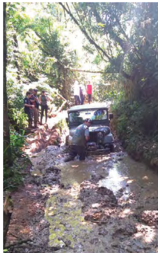
Obstáculos mostravam a cara a todo momento

às 9h30, onde logo de cara já encontraram obstáculos. Todos os jeeps usaram guincho para sair das enrascadas. Em toda a trilha foi necessário o acessório,