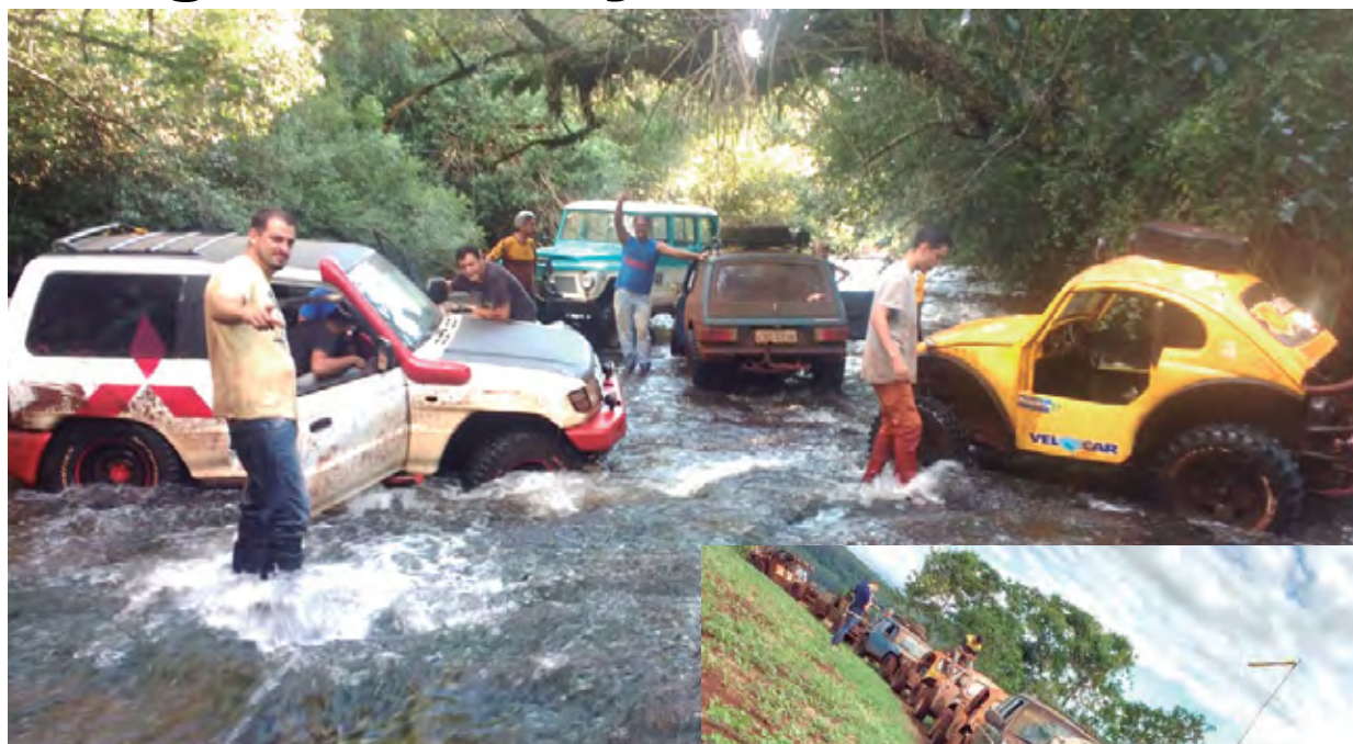
Amizade é o principal lema do grupo

Um grupo de aventureiros de Apucarana/PR realiza passeios semanais na área rural da cidade, sempre em prol do Off Road e do companheirismo entre amigos. A Equipe Alfa Off Road é um clã de amigos, que sempre traz novos convidados. Os amigos ainda fazem parte do Jipe Clube de Apucarana.