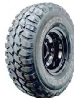
Pneu 33x12,5 R15 Mud-Terrain GT Radial Adventuro Lateral mais Reforçada do mercado, 70% off road À vista no boleto: R$ 836,07 ou 6x de R$ 149,83