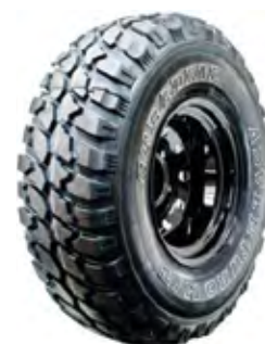
Pneu GT Radial Adventuro 305/70 R16 maior que um pneu 33 de altura com Lateral Reforçada À vista no boleto: R$ 887,22 ou 6x de R$ 159,00