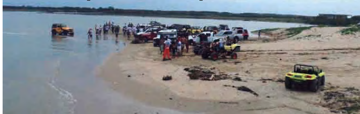
Praia foi tomada pelo Off Road

O 4º Encontro de Jipeiros de Farol de São Thomé, do Jeep Clube de Campos dos Goytacazes/RJ, ocorrido de 15 a 17 de fevereiro foi de tirar o fôlego. O evento reuniu trilhas e passeios, com pistas de obstáculos, cabo de guerra e arrancadão, levando entretenimento para 300 pessoas na Praia do Farol, o balneário point do verão campista, abrindo assim a temporada de eventos Off Road regionais.