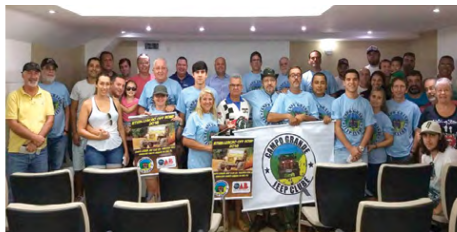
Amigos puderam se atualizar com novas informações

possibilitou a atualização dos integrantes quanto as regras de segurança que de-