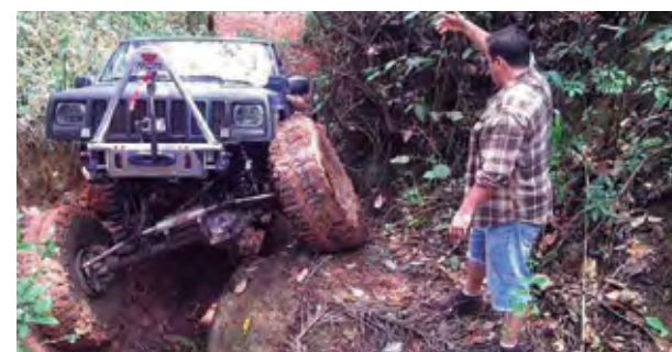
Aventura promete "terror" e alegria

A largada acontece às 22h do bar do Pedrão e todos estão convidados para esta incrível trilha noturna. É bom não subestimar o Pinheirinho. Vá equipa-