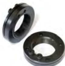
Porca Travente Para manga de eixo reforçada e original