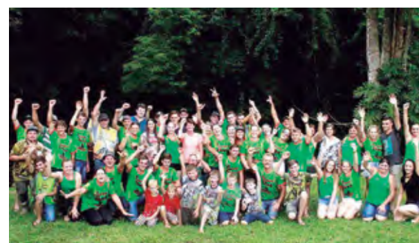
Galera esbanjava felicidade

A aventura trouxe duas largadas diferenciadas, umas às 9h para quadris e UTVs e mais tarde para as motos. Rolou muita adrenalina para todos os trilheiros e familiares, além do local para descanso "neutro", onde ganham lanche todos presentes. Após muita emoção aconteceu o almoço feito pelo próprio Restaurante Ruda, onde esperaram pelo sorteio da moto e vários outros brindes. No local do evento as famílias desfrutaram de