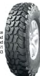
Pneu 265/70 R17 WestLake Mud Terrain - 70% OFF-Road 30% On-Road À vista no boleto: R$964,41 ou 6x de R$172,83