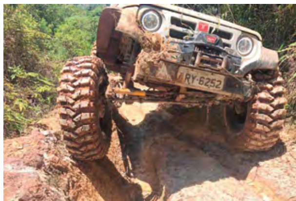
Máquinas deram conta do recado

Rua Adolfo da Veiga, 447, Boehmerwald, Joinville, SC