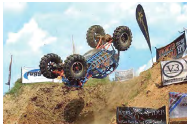
Equipamento garante eficiência no Off Road extremo

Acesse www.geniustyres.com.br ou solicite atendimento via telefone (15) 3222.9222.