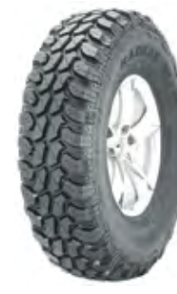
Pneu 37x12,5 R17 Westlake 70% Offroad / 30% Onroad À vista no boleto: R$ 1.181,10 ou 6x de R$ 211,67