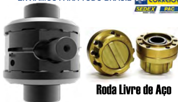
Roda Livre de Aço