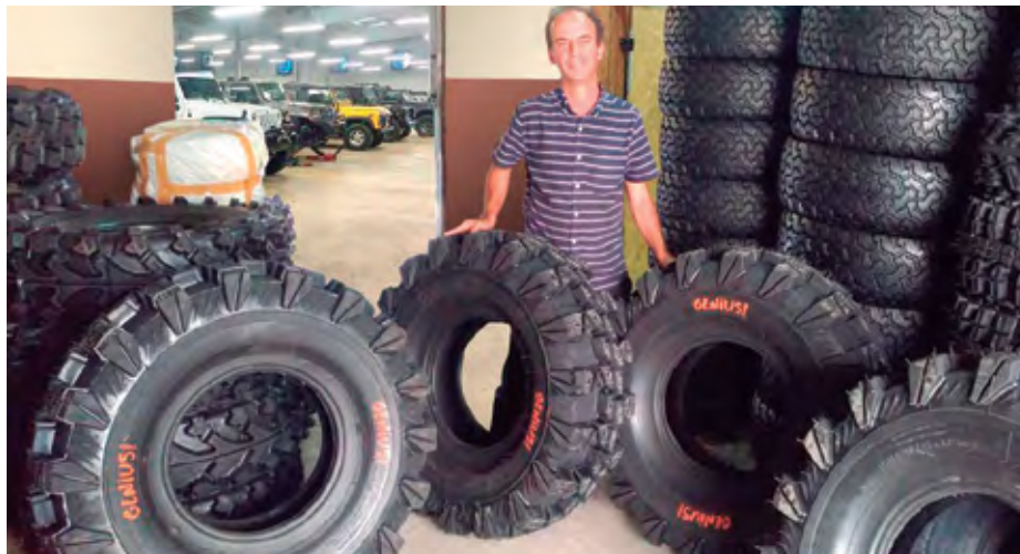
Qualidade e confiança no mundo dos pneus

Um dos pneus que mais obteve a preferência dos praticantes de Off Road foi o modelo Ignorante, inclusive é o único modelo a ter a opção de ser adquirido sem o processo de recapamento, isso mesmo, é o único pneu brasileiro fabricado como novo para uso extremo, e em 2019 chegará ao mercado sua 5ª versão, batizada de Super Ignorante, nem precisamos dizer que este modelo vem para superar todos os desafios que