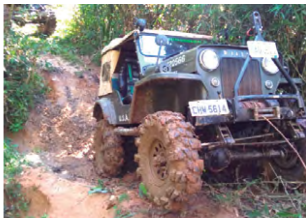
Trilheiros fizeram bonito no passeio

terminando quase às 14h. Lá, o comboio parou na porteira do Parque Estadual da Serra do Mar para finalizar com um belo churrasco.